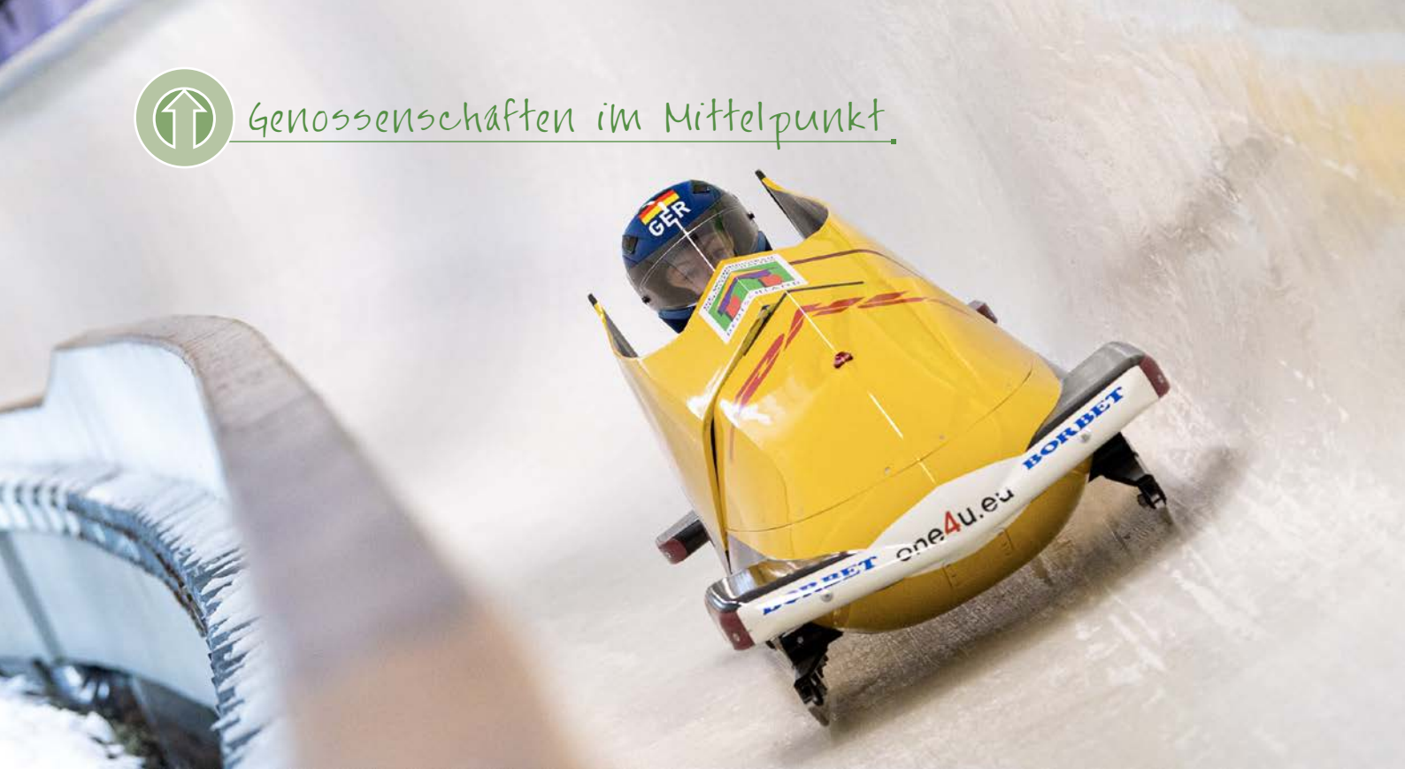
Laura Nolte im Monobob beim Training in Whistler